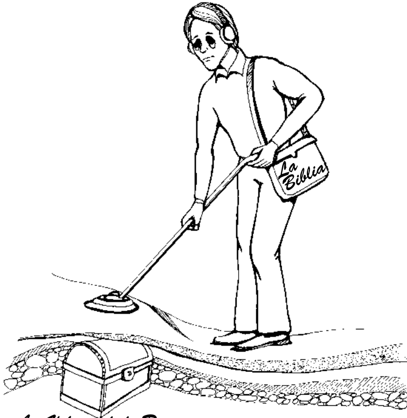
La Voluntad de Dios